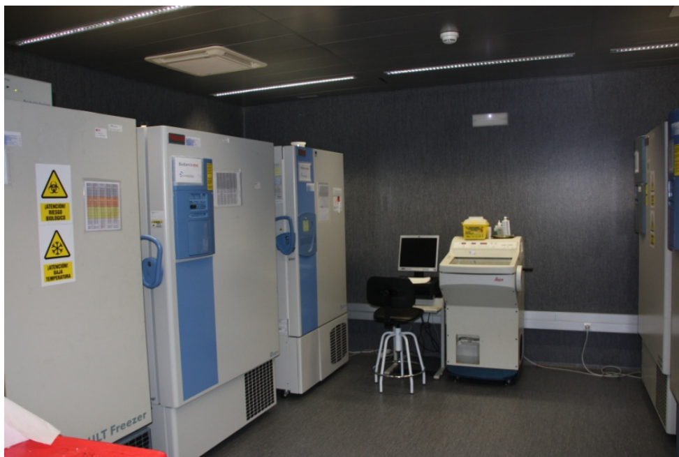
Biobankuko hozkailuak, non ehunak 80 gradutik beherako tenperaturan gordetzen baitira.