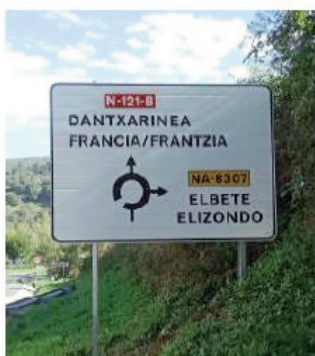
27.-P.K. 51+130 de la N-121-B Creciente.