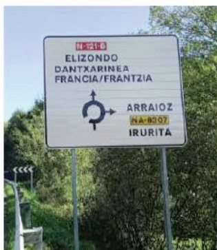
28.-P.K. 46+010 de la N-121-B Creciente.

“Frantzia” izendapena ipintzen ari dira N-121-A eta N-121-B errepideetan egindako obregatik jarri berri dituzten seinaleetan. Instalaturako kartelean eranskina jartzeko programatuta daude lanak, horretarako behar adina espazio fisiko badago.