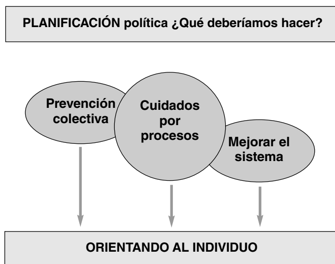
Representación esquemática de la Planificación política

Este planteamiento puede esquematizarse del modo siguiente: