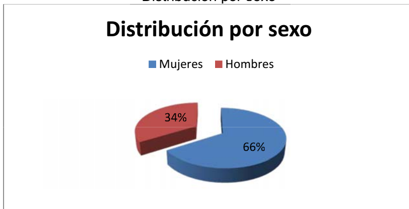
Distribución por sexo

Como se aprecia en el siguiente gráfico, el 66% de las personas atendidas son mujeres, frente al 34% de hombres. Esta tónica se ha mantenido a lo largo de los años con muy poca variación en los porcentajes