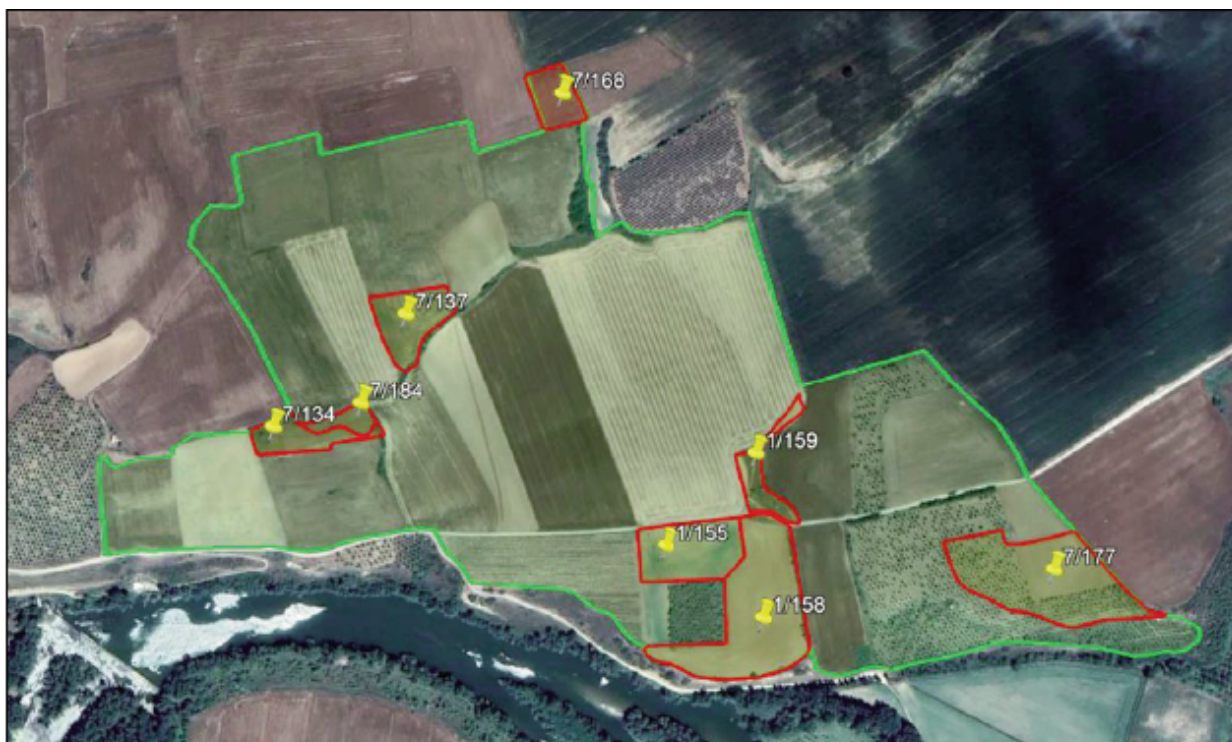
Relación de terrenos afectados para Sangüesa II.

alquiler 6,57 ha de terreno comunal de las parcelas 134, 137, 155, 158, 159, 168, 177 y 184 del polígono 7 en el término municipal de Cáseda, cuyo plano de situación exacta se acompaña en el anexo adjunto a este acuerdo.