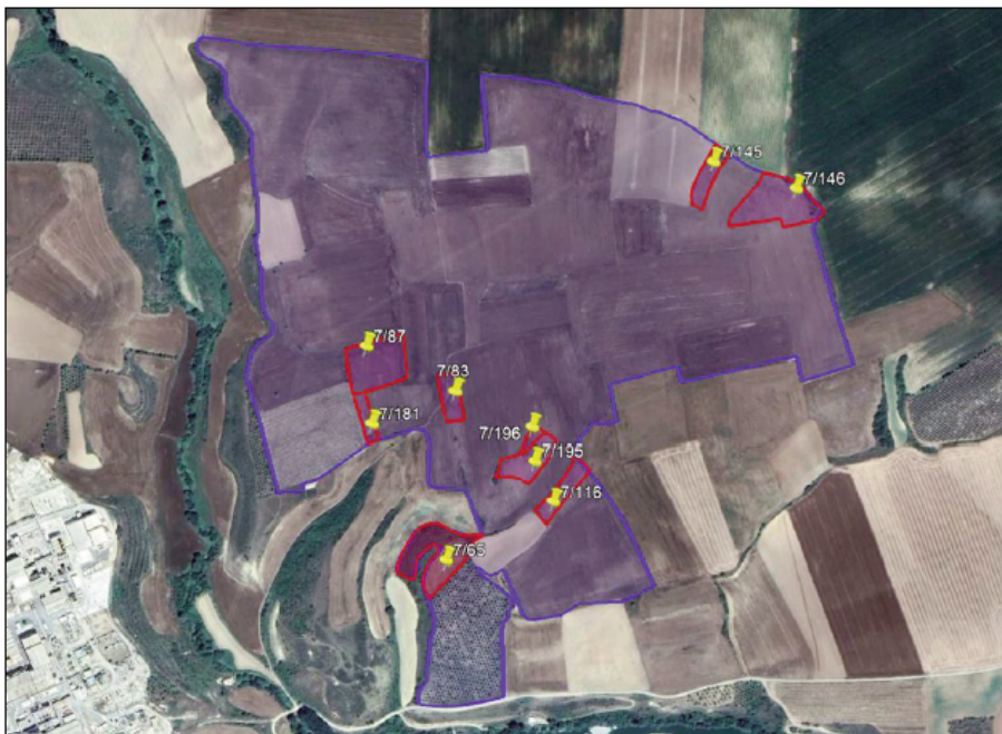
Relación de terrenos afectados para Sangüesa I.

1- Desafectar para la planta solar "Sangüesa I", mediante Acuerdo inicial del Pleno del Ayuntamiento adoptado por mayoría absoluta, de conformidad con el procedimiento señalado en el artículo 140.2 de la citada Ley Foral de la Administración Local de Navarra, con destino a su alquiler 3,44 ha de terreno comunal de las parcelas 65, 83, 87, 116, 145, 146, 181, 195 y 196 del polígono 7 en el término municipal de Cáseda, cuyo plano de situación exacta se acompaña en el anexo adjunto a este acuerdo.