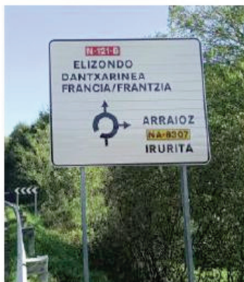
28.-P.K. 46+010 de la N-121-B Creciente.

Se está incorporando la denominación “Frantzia” en las señales colocadas recientemente por nuevas obras ejecutadas en la N-121-A y en la N-121-B. Los trabajos están programados para colocar el añadido en el cartel instalado, siempre y cuando exista espacio físico suficiente.