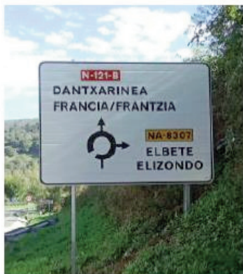
27.-P.K. 51+130 de la N-121-B Creciente.