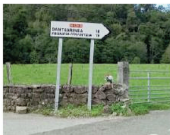
26.-P.K. 53+880 de la N-121-B Creciente.