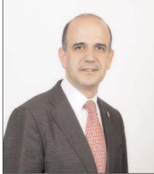
Alberto Catalán Higuera. Natural de Corella (7-11-62). Farmacéutico. Presidente del Parlamento de Navarra. Comisiones: Reglamento y Permanente.