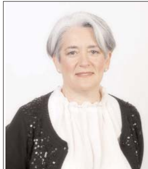
Lourdes Goicoechea Zubelzu. Natural de Tolosa, Gipuzkoa (28-8-60). Asesora Fiscal y Contable. Consejera de Desarrollo Rural, Industria, Empleo y Medio Ambiente. Sustituida por Carmen Ferrer el 2-9-2011.