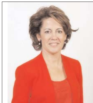
Yolanda Barcina Angulo. Natural de Burgos (4-4-60). Catedrática de la UPNA. Presidenta del Gobierno de Navarra.