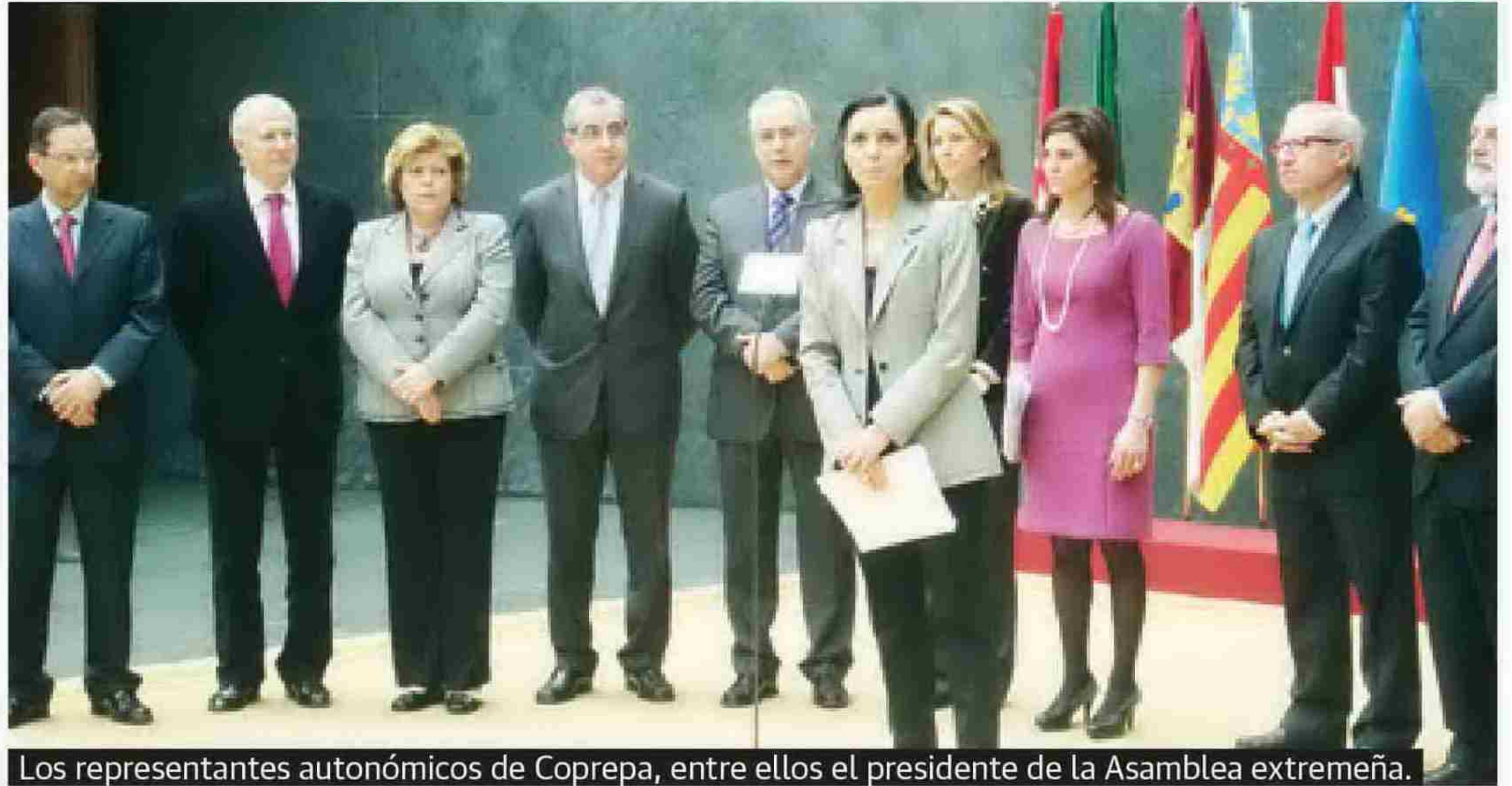
Los representantes autonómicos de Coprepa, entre ellos el presidente de la Asamblea extremeña.

La presidenta del parlamento gallego, Pilar Rojo Nogueira, ha sido elegida por el plenario de la Conferencia de Presidentes de Parlamentos Autonómicos de España (Coprepa), para presidirla durante los próximos doce meses. El presidente de la Asamblea de Extremadura, Juan Ramón Ferreira, destacó en la Coprepa el acuerdo para coordinar la consulta legislativa europea.