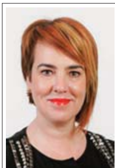
AINHOA AZNÁREZ IGARZA. Natural de Pamplona/Iruña (04/08/1970). Educadora Infantil. Presidenta del Parlamento. Comisiones: Convivencia y Solidaridad Internacional; Cultura, Deporte y Juventud.